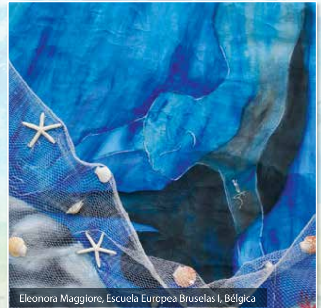
Eleonora Maggiore, Escuela Europea Bruselas I, Bélgica