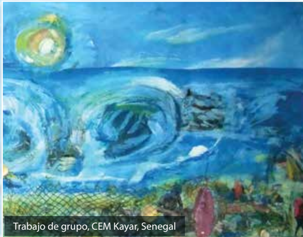
Trabajo de grupo, CEM Kayar, Senegal

Somos científicos, artistas, profesores y padres preocupados de diferentes regiones del mundo, que hemos unido nuestros esfuerzos para promover la transición hacia valores y prácticas de sostenibilidad y de vidas humanas dignas.