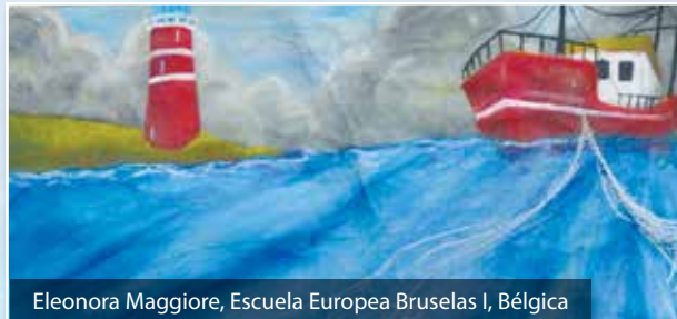
Eleonora Maggiore, Escuela Europea Bruselas I, Bélgica