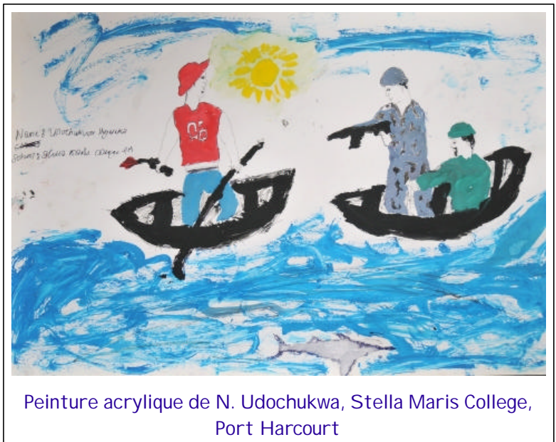
Peinture acrylique de N. Udochukwa, Stella Maris College, Port Harcourt

Voilà comment les jeunes du Collège de Stella Maris de Port Harcourt, des Ecoles secondaires communautaires de Abuluma et de Okochiri, Okrika, tous situés dans le Rivers State, peignent leurs alentours. Le Directeur-adjoint de Stella Maris a vivement soutenu ce travail avec le coordinateur du Peace Club (Club de la Paix) à Okrika.