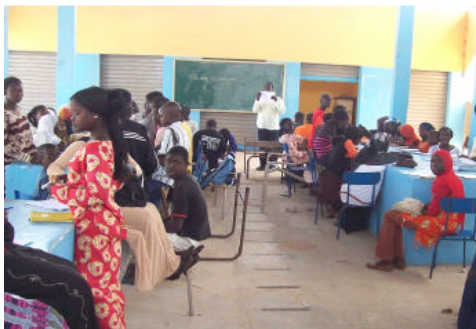
Le récent atelier de peinture visant à préparer la participation de Kayar à l'exposition d'Amsterdam s'est tenu dans le hall du marché occupé par le collège