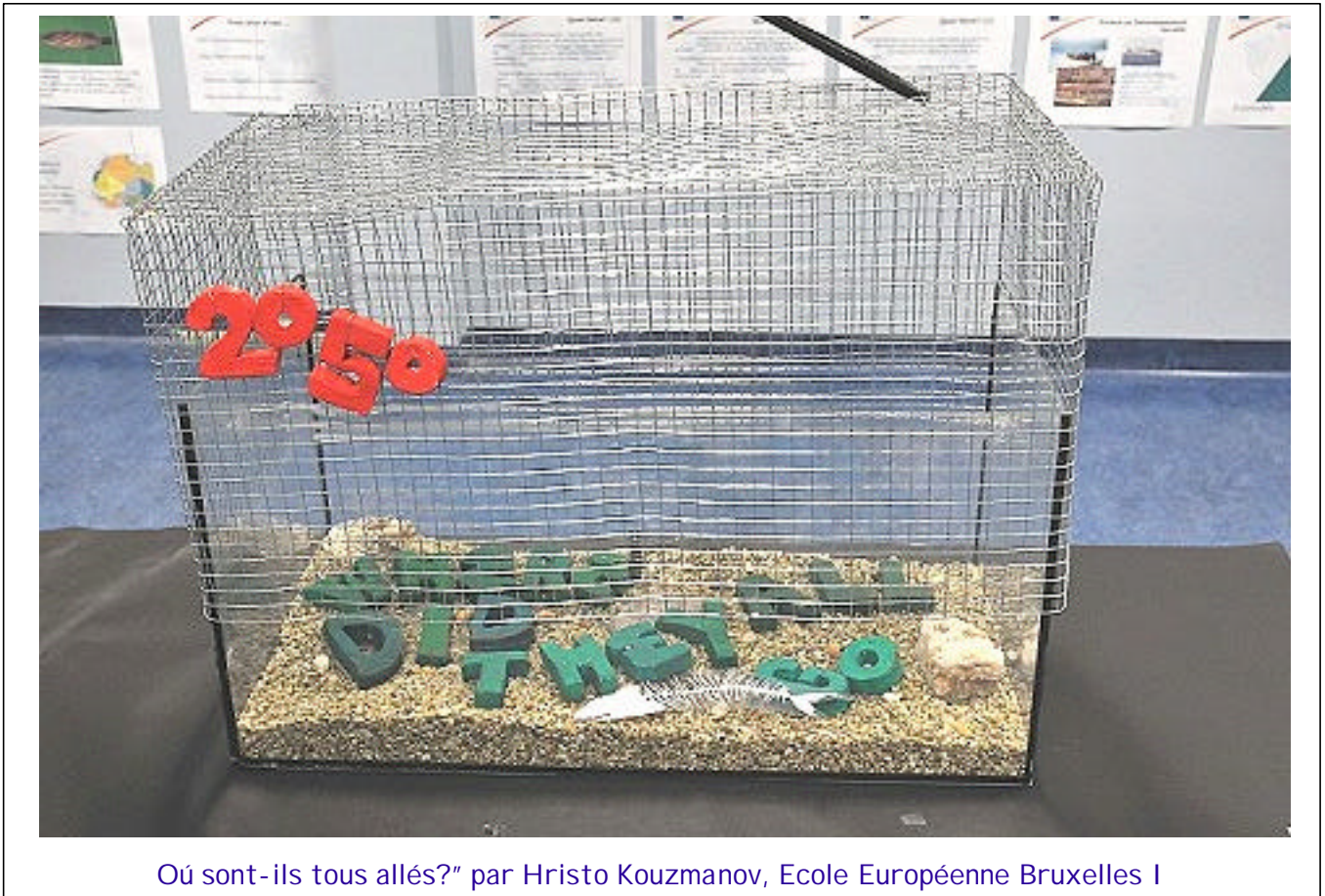
Où sont-ils tous allés?" par Hristo Kouzmanov, Ecole Européenne Bruxelles I