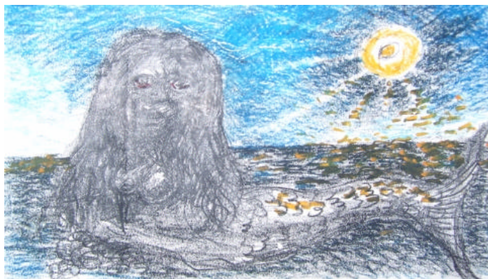
Déesse de l'eau, Coumba Castle, l'île de Gorée, de Diogomaye

Quel futur veulent-ils pour leurs enfants? A quoi les jeunes aspirent-ils? L'accès à une meilleure éducation et à la connaissance scientifique, sans pour autant se départir de la