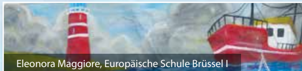
Eleonora Maggiore, Europäische Schule Brüssel |

mobilisieren finanzielle Unterstützung zur Zusammenarbeit mit Blick auf die Ziele der Initiative.