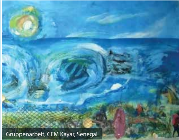
Gruppenarbeit, CEM Kayar, Senegal

Wir sind Wissenschaftler/innen, Künstler/innen und Lehrer/innen, besorgte Eltern aus verschiedenen Regionen der Erde, die sich gemeinsam für eine Änderung hin zu nachhaltigen Werten und Praktiken, sowie einem würdigen menschlichen Dasein einsetzen.