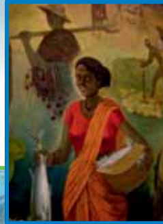
«DONNA NELLA PESCA» C.S. KARKAR (INDIA)